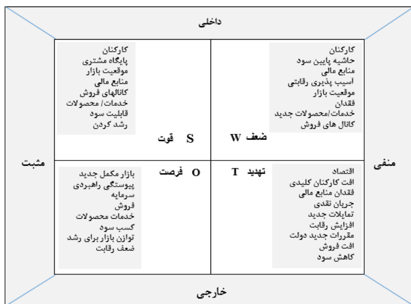
شکل ۱. ترکیب SWOT (بی و یانگ، ۲۰۱۳)

جنبه از یک مورد را بررسی و سپس ارزیابی و در نهایت نتیجه-گیری می‌نماید (شکل ۱).