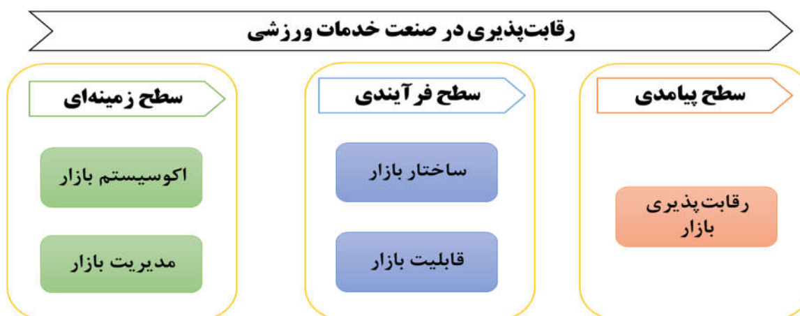
شکل ۱. چارچوب مفهومی عوامل بلوغ مدیریت فرایندهای کسب و کار در شرکت‌های تولیدی ورزشی