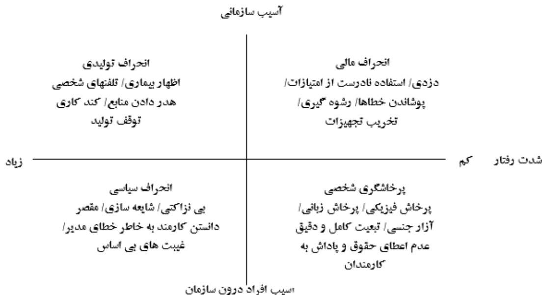
شکل ۱. طبقه‌بندی رفتارهای انحرافی

انحرافی را توجیه می‌نماید، رویکرد استرس - نامتعادلی - جبران است. از مفروضات اصلی این رویکرد این مفروضه اهمیت بسیاری دارد که عوامل استرس آور در هر یک از قالب‌های مطرح نظیر تعارضات میان فردی، افراد را از حالت تعادل هیجانی، شناختی و رفتاری خارج می‌کند. این خارج شدن از حالت تعادل برای انسان‌ها ماهیت انگیزشی دارد. به این شکل که افراد با تجربه استرس و فقدان تعادل ناشی از آن نظیر فرسودگی شغلی به تکاپو می‌افتند تا تعادل از دست رفته را بازگردانی کنند. این بازگردانی به صورت کاهش تمایلات رفتاری مثبت نظیر رفتارهای مدنی سازمانی و خلاقیت و افزایش تمایلات رفتاری منفی نظیر رفتارهای انحرافی نمود می‌یابند (گل پرور و همکاران، ۱۳۹۲). گل پرور و همکاران (۱۳۸۹). در پژوهشی روی کارکنان شرکت ذوب آهن نشان دادند که بین دو متغیر فرسودگی هیجانی و رفتار انحرافی رابطه مثبت و معناداری وجود دارد. در پژوهشی دیگر روی دو مجموعه صنعتی در اصفهان نیز مشخص شد بین فرسودگی هیجانی و رفتار انحرافی رابطه مثبت و معناداری وجود دارد (گل پرور و همکاران، ۱۳۹۱).