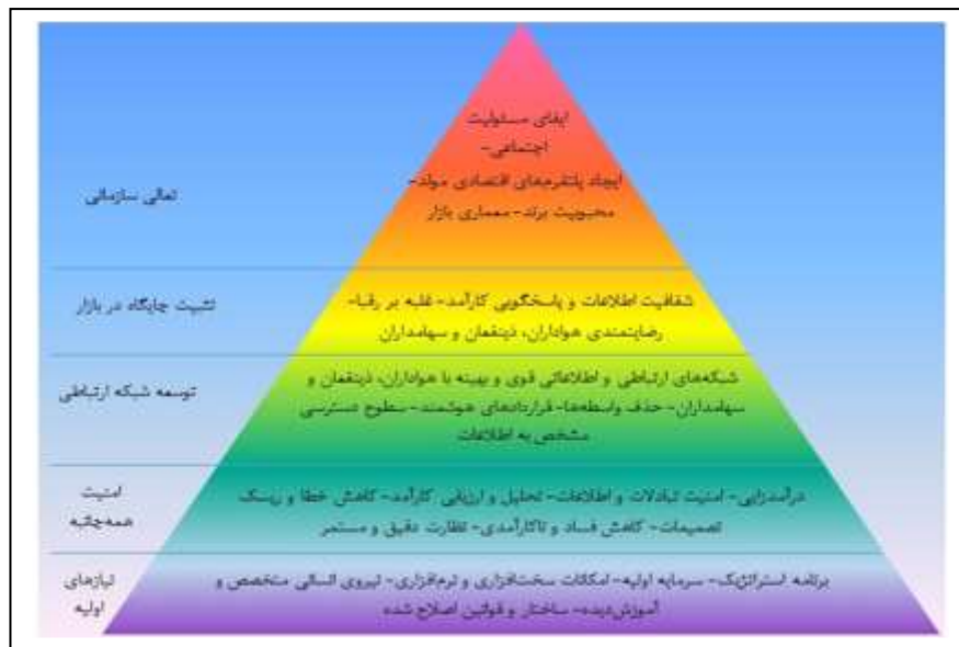
شکل ۲. هرم نیازهای باشگاه ورزشی حرفه‌ای مجهز به فناوری دفتر کل توزیع شده

می‌تواند انگیزه‌ها را کاهش دهد. فاز اول اجرای دی. ال. تی هر باشگاه ورزشی حرفه‌ای به تبع دشوارترین گام خواهد بود چراکه بیشترین موانع و چالش‌ها در این سطح قرار دارند و می‌بایست فوریت‌ها به‌درستی تشخیص داده شود و کلیه برنامه‌ریزی‌ها و تأمین بودجه به نحو صحیح طرح‌ریزی و فازبندی شود. در غیر این صورت، از آنجا که اجرای هر فاز، پیشران اجرای فاز بعدی است، ممکن است پروژه در میانه راه رها شود.