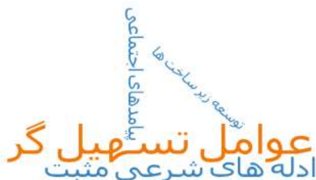
شکل ۴. نمای ابری مؤلفه‌ها، زیر مؤلفه‌ها عوامل تسهیلگر چالش‌های حضور بانوان در ورزشگاه‌های ایران

با اشاره به شکل ۳ و شکل ۴ که خروجی نهایی نرم‌افزار است، عوامل تسهیلگر چالش‌های حضور بانوان در ورزشگاه‌های ایران نشان داده شده است که با توجه به