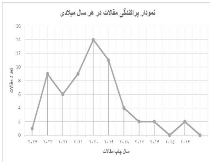
شکل ۲. روند انتشار منابع مطالعاتی در بازه زمانی ۲۰۱۴-۲۰۲۴