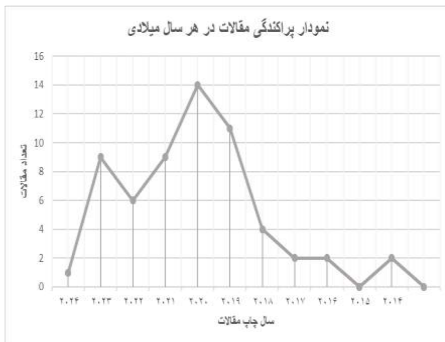
شکل ۲. روند انتشار منابع مطالعاتی در بازه زمانی ۲۰۱۴-۲۰۲۴