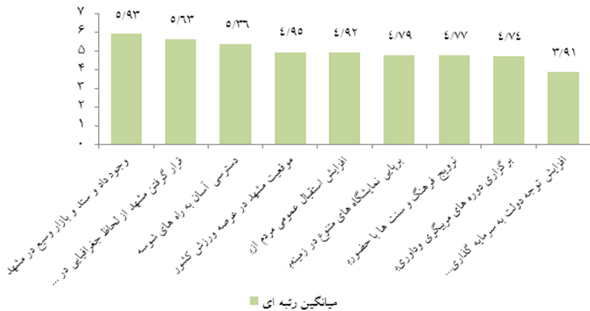
نمودار ۳. اولویت بندی گویه های مربوط به فرصت های موجود در زمینه گردشگری ورزشی در شهر مشهد

تعصبات مذهبی- اجتماعی در میان مردم، وجود تبلیغات منفی در خارج از کشور، افزایش انواع آلودگی ها (هوا، صوتی و...)، عدم وجود تسهیلات ویژه برای صدور روادید و امور گمرکی گردشگران، ضعف در ناوگان حمل و نقل هوایی و ضعف در ناوگان حمل و نقل ریلی برون شهری می باشند.