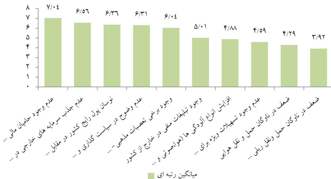
نمودار ۴. اولویت بندی گویه های مربوط به تهدیدهای موجود در زمینه گردشگری ورزشی در شهر مشهد

در خصوص شاخص های مطرح شده به ترتیب اهمیت، شاخص اقتصادی و یازاریابی، شاخص اجتماعی و فرهنگی، شاخص خدمات و حمل و نقل، شاخص تسهیلات و رویدادهای ورزشی و شاخص جاذبه های گردشگری بر گردشگری ورزشی در شهر مشهد تأثیرگذار می باشد.