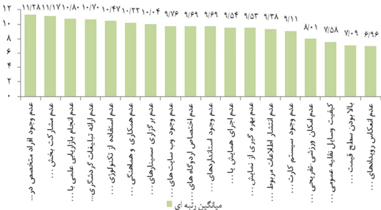
نمودار ۲. اولویت بندی گویه های مربوط به نقاط ضعف در زمینه گردشگری ورزشی در شهر مشهد

عمومی مردم از رویدادهای ورزشی، برپایی نمایشگاه های متنوع در زمینه های مختلف، ترویج فرهنگ و سنت ها با حضور گردشگران ورزشی، برگزاری دوره های مربیگری و داوری مختلف و افزایش توجه دولت به سرمایه گذاری در بخش گردشگری می باشد.