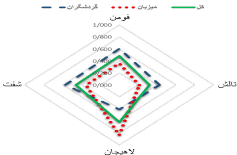
شکل ۲. بارومتر پایداری مناطق مورد بررسی به تفکیک جامعه میزبان و گردشگران ورزشی

نتایج مربوط به میزان پایداری ابعاد اقتصادی، اجتماعی- فرهنگی و زیست محیطی گردشگری ورزشی به تفکیک مناطق مورد بررسی از دیدگاه جامعه میزبان و گردشگران ورزشی در جدول ۴ آورده شده است. بارومتر مربوط به میزان پایداری به تفکیک مناطق در شکل ۳ آمده است (شکل ۳).